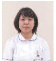
糖尿病看護認定看護師

糖尿病は生活習慣病の代表的な病気ですが、よく知ることで予防したり上手に付き合ったりすることができます。当院では糖尿病を理解していただくためのイベントを開催します。当日は、医師・管理栄養士・薬剤師・看護師・理学療法士・臨床検査技師が糖尿病に関する相談をお受けしますので、糖尿病に関心をお持ちの方は、お気軽にお越しください。申し込みは不要です。