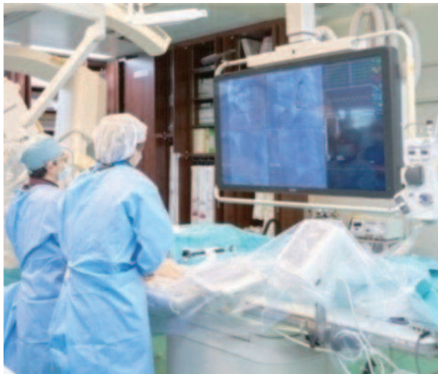
虚血性心疾患のPCI手術 (28年実績は約500症例以上)

循環器内科では、昼夜を問わず緊急カテーテル手術を行って、血栓を除去したり、スtentと呼ばれる金網の筒を留置して血流を回復させています。この冠動脈内に溜ったドロドロの血栓の除去は容易ではなく、不用意にバルーンで拡張すると血管内に飛び散って余計に血流低下することもあります。これまではカテーテルを血管内に挿入して血栓を吸引してきましたが、当院では昨年よりエキシマレーザーという新しい治療法を導入しました。このレーザーは熱を出すことはありませんが、カテーテルからレーザーを血栓に照射すると、一瞬で5マイクロミリメートル以下の超微細な破片に砕いてしまうことが出来ます。血栓以外に、カテーテル手術を難しくする要素が冠動脈の石灰化です。糖尿病や人工透析の患者さんは、カルシウムが高度沈着するため、通常のバルーン治療では全く歯が立たないことも多々あり、このような症例に威力を発揮するのがロータブレーターです。これは、先端がダイヤモンドで高速回転させてカルシウムを削り飛ばす治療で、難攻不落の石灰化病変もねじ伏せることが可能です。